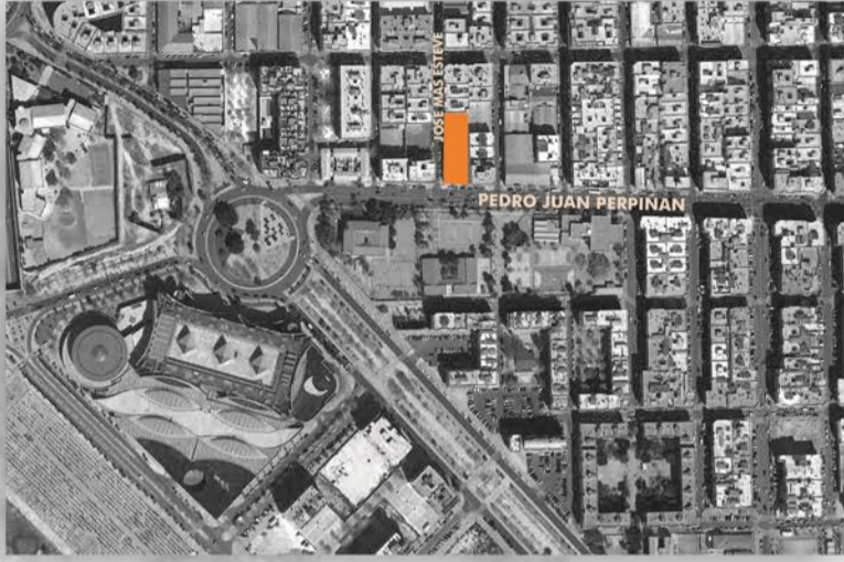
REPRESENTACION ARTISTICA SIN VALOR CONTRACTUAL SUJETA A POSIBLES MODIFICACIONES