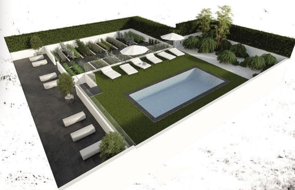
PLANTA PISO 4. VIVIENDA 03. 1/50