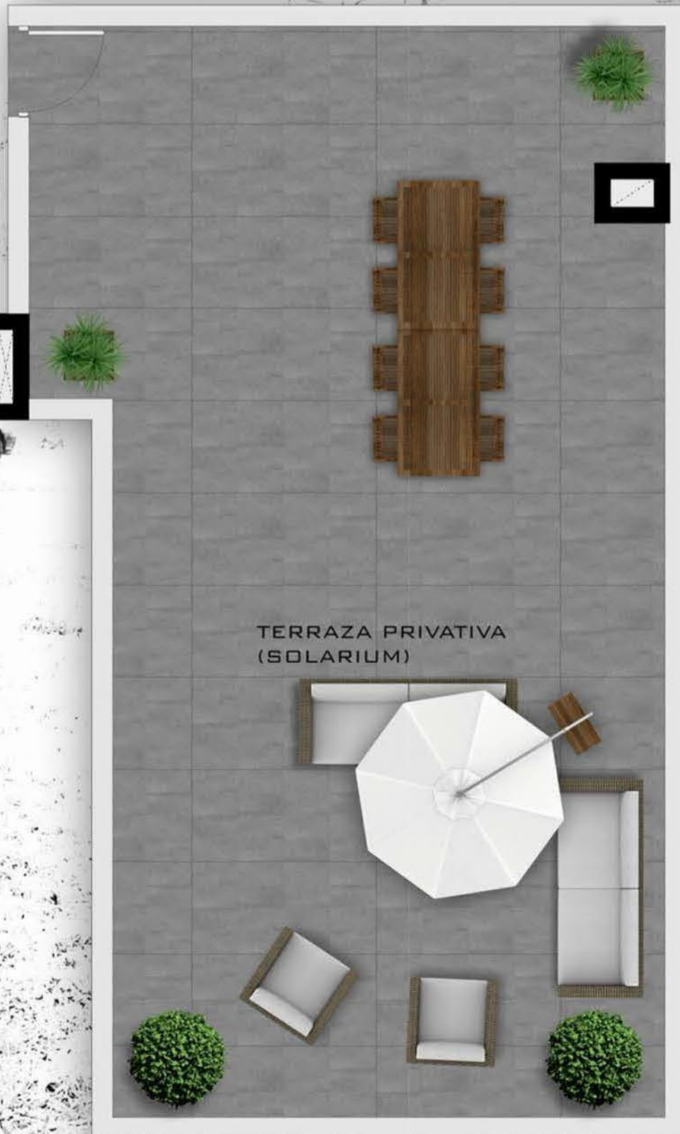
TERRAZA PRIVATIVA (SOLARIUM)